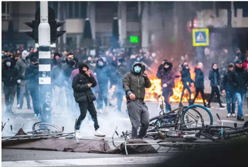
Op 18 september verzamelden honderden mensen zich in Eindhoven op het 18 Septemberplein om te demonstreren tegen de avondklok.